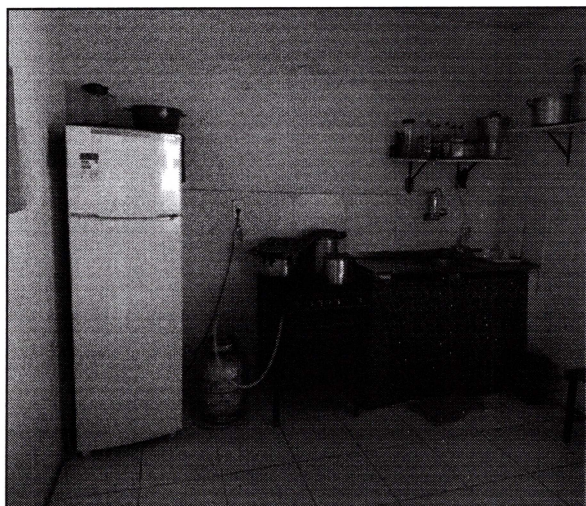
Imagem 09: Cozinha da escola. Pintada, com piso cerâmico e revestimento cerâmico apenas acima da pia.