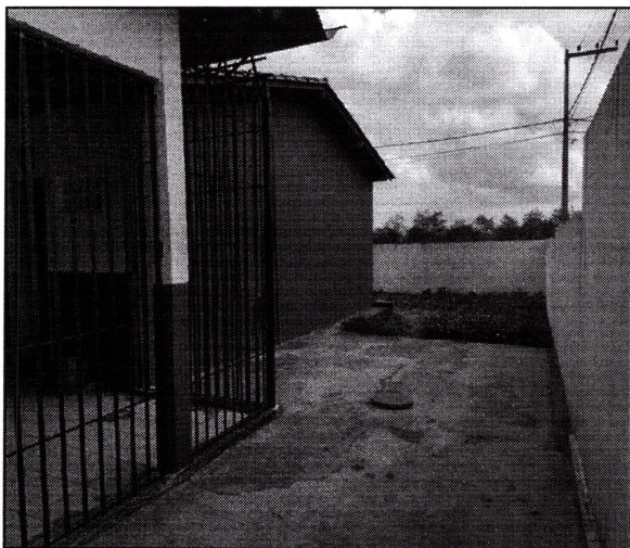
Imagem 03: Área descoberta da escola.