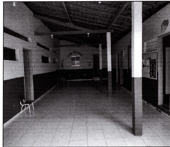
Imagem 02: Pátio coberto da escola. Paredes pintadas e com piso cerâmico.