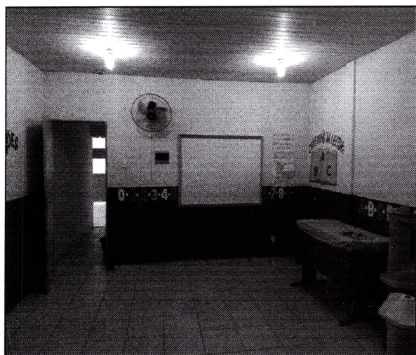
Imagem 05: Sala de aula pintada, com piso cerâmico, forro de PVC, lâmpadas e ventiladores instalados.