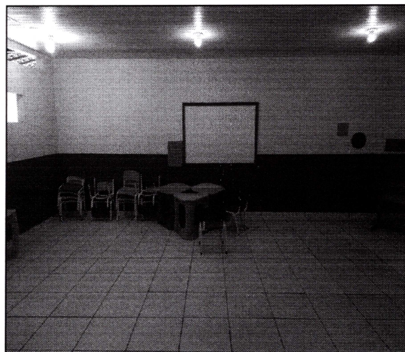
Imagem 06: Sala de aula pintada, com piso cerâmico, forro de PVC, lâmpadas e instaladas.