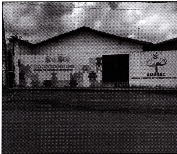
Imagem 01: Fachada da escola.