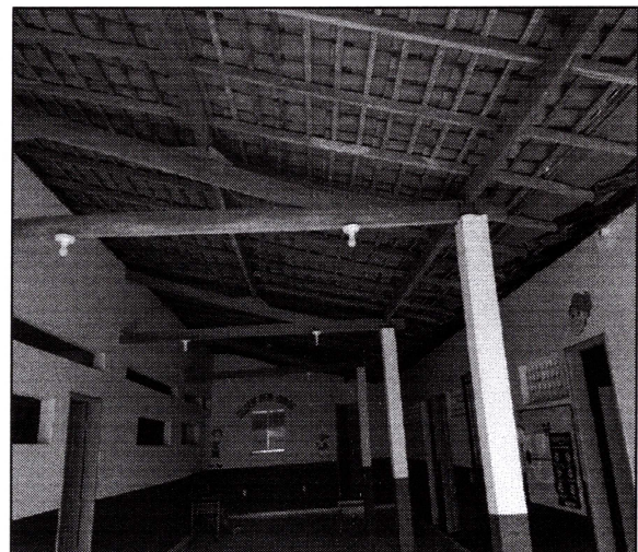
Imagem 04: Cobertura em estrutura de madeira e telha cerâmica.