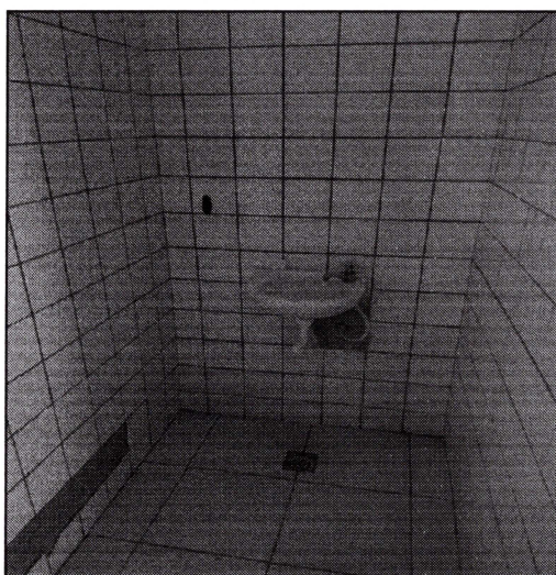
Imagem 11: Banheiro, com piso e revestimento cerâmico.