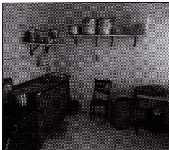
Imagem 10: Cozinha da escola. Pintada, com piso cerâmico e revestimento cerâmico apenas acima da pia.