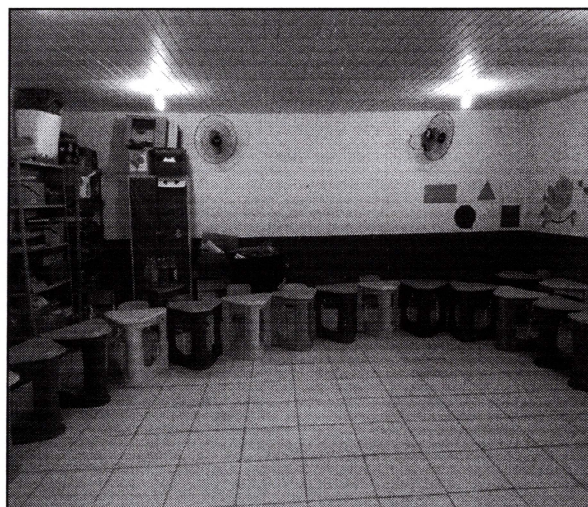
Imagem 08: Sala de aula pintada, com piso cerâmico, forro de PVC, lâmpadas e ventiladores instalados.