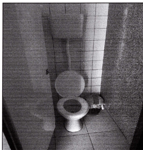
Imagem 12: Banheiro, com piso e revestimento cerâmico.