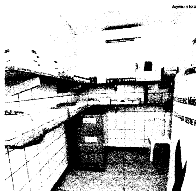
Posto de saúde foi reequipado e teve estoque de remédios renovado