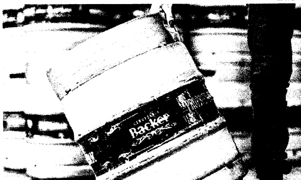
Lotes contaminados são de 12 rótulos diferentes e foram produzidos entre julho de 2019 e janeiro de 2020

O processo de regularização de uma empresa junto ao Mapa inicia-se com a concessão do registro do estabelecimento, o que a habilita a funcionar e comercializar seus produtos. Durante o processo de registro, são solicitados documentos comprobatórios da habilitação para o funcionamento da empresa e en-