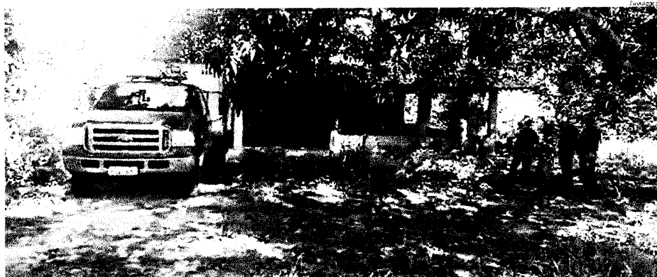
Sítio onde o italiano Alfredo Catalane, de 69 anos, residia sozinho há quatro anos, nas proximidades do Viva Maioba; ano passado, houve tentativa de roubo no local