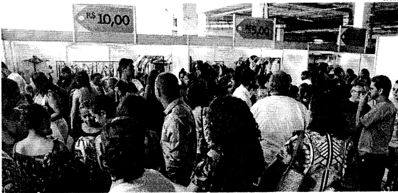
Edição do Brechó de Natal do ano passado teve grande número de doações e foi sucesso nos estandes instalados no Shopping da Ilha

São Luís, Segunda-feira, 25 de novembro de 2019