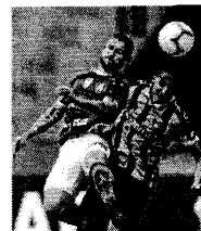
Lance de Palmeiras x Grêmio